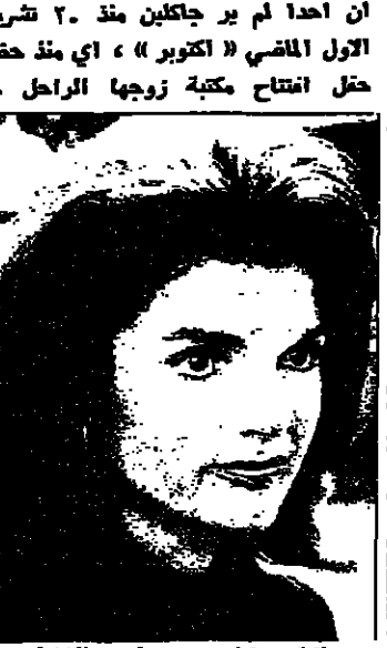
لا تغفها يا تيد! في نيويورك يقول القرون من ال كينيدي ان احدا لم ير جاكلين منذ ٢٠ شربين الاول الماضي (اكتوبر) ، اي منذ حضرت حفل افتتاح مكتبة زوجها الراحل جون

جاكلين كينيدي : اين الناطور ؟ بضرب كل عائلة كينيدي وحضور كل شخصيا . وكان مراسل مجلة « بيلد » الالمانية الضيفة في نيويورك قد نشر لاول مرة خبر محاورته لجاكلين جاكلين كينيدي ، وتتل ذلك حجة كبرى . موجز الخبر الذي نشره مراسل بيلد ان جاكلي كتبت على ظهر يديها بالبريق من بايلسيوت على الساحل الشرقي للولايات المتحدة حين وجدت « مينيها » ذات بعد ظهر حار ان سيدتها تلم نسى مقصورتها بلا حراك . ولم تمر الوصية نوم سيدتها اهتماما كبيرا لولا طهارتين : الاولى ان السيدة لم تخرج من مقصورتها منذ ما يزيد على ١٨ ساعة ، والثانية ان بجانبها علبة حبوب منومة فارغة تماما ، وهي تسع لثلاثين حبة . وعاد اليها الى الساحل نورا ، وهناك جرت الاسفلات الولية ، ثم حملت بعد ذلك الى فيلا ال كينيدي واحيط خبر انتعاشها بالسريرة والكتمان . اين الحقيقة من كل هذا الخبر ؟ هناك عدة مؤشرات تدل على ان زوجة اصحاب المليات تمر الان بمرحلة ارقاق وانحلال اعصاب . وتقول السيدة ادث بيل ، وهي ابنة خالة جاكلي كينيدي ان ترشح ادوارد شقيق زوجها الراحل قصب الرئاسة قد اصابها بصدمة عظيمة كبيرة . فجاة شعرت جاكلي ان الماضي يعبر امام عينيها بكل قسوته ، وتذكرت اشبح اللحظات التي عاشتها ، واحست انها مسكونة من جديد بالقلق المولدة لوت زوجها الذي اغفل في « عز شديده » امام عينيها وهي التي كتبت تحبه جدا . وتذكرت كذلك مقل اخيه روبرت في ظروف مؤلمة . وتضيف ابنة الخالة ادث بيل ان جاكلي لم تصق حتى الان ان تيد غلا يريد ان يريح نفسه كترسي الرئاسة . لقد كتبت حتى اخر لحظة تامل ان يغير تيد رأيه ويتراجع عن قراره حتى لا تتكرر المأساة الثالثة امام عينيها .